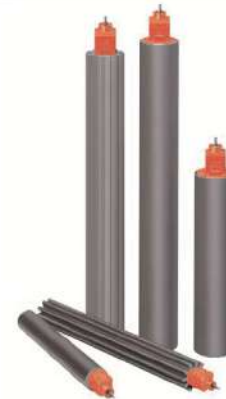
Ánodos Ebonex y conectores eléctricos

Cuando se requiera un sistema de protección catódica a los elementos de concreto reforzado, deberá proveerse mediante el uso de ánodos Ebonex, suministrados por Vector Corrosion Technologies. Los ánodos Ebonex, deberán ser capaces de asegurar un desempeño estable del sistema durante su vida útil, con densidades de corriente de hasta 900 mA/m 2 (por superficie del ánodo). Los ánodos Ebonex, tendrán sistema de ventilación. Se utilizara mortero Ebofix, tixotrópico de alta densidad, absorbente de ácidos, en la instalación de los ánodos.